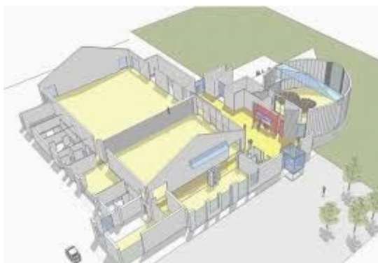
Et tidligere udkast.

I det projekt har vi den store blyant fremme, hvor der udover udvidelsen af hallen også snakkes om at flytte børnehaven fra Solhøj, flytte sportspladsen, høkeren og lave nye tilkørselsforhold fra hovedvejen. Her var ingen ideer, som var for vilde.