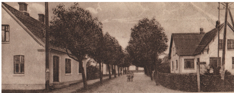
Partier fra Andst