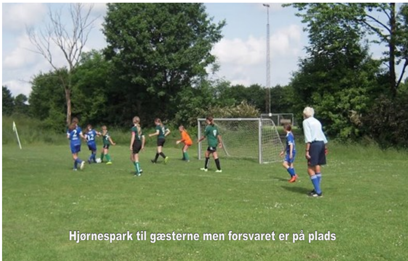
Hjørnespark til gæsterne men forsvaret er på plads

U 10-pigerne var også på hjemmebane, og de hentede to sejre.